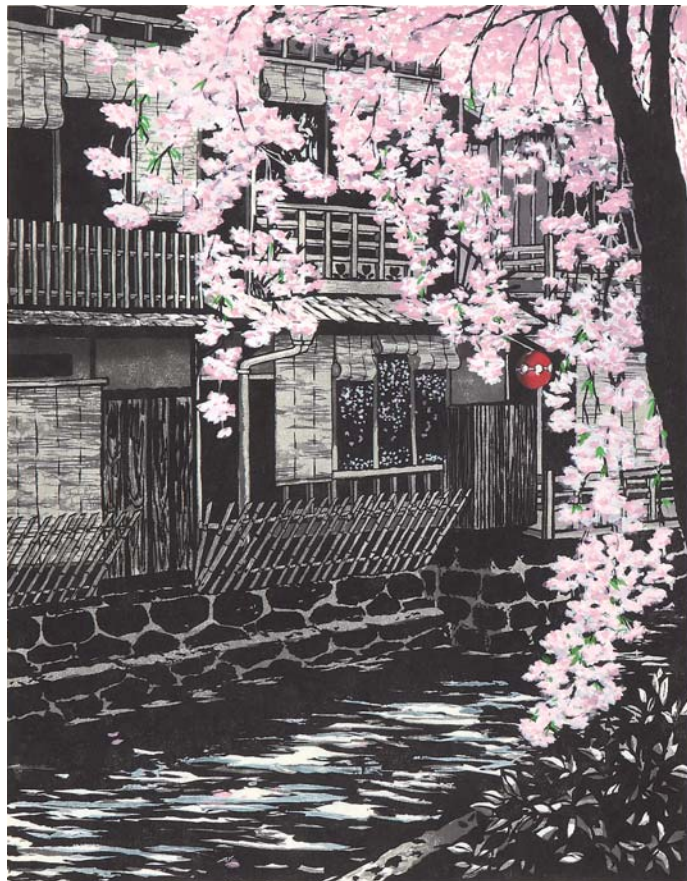
《祇園白川》2004年 第80回記念白日会展出品

力強く、そして繊細に、私たちに語りかけるような静かな佇まいを醸し出すジュディ・オング倩玉の木版画の世界をご堪能ください。