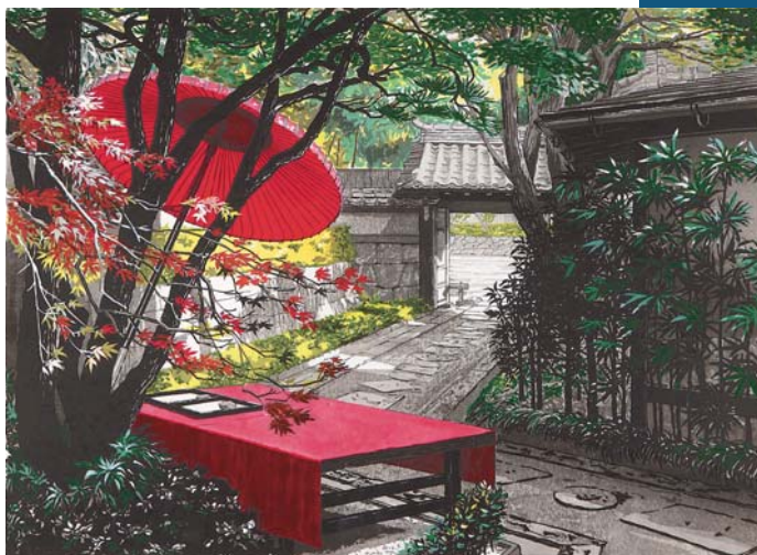
《涼庭忘夏》2008年 第40回日展入選

11歳の時、日米合作映画「大津波」で女優デビュー。1979年「魅せられて」のミリオンヒットにより、日本レコード大賞他数々の賞を受賞。