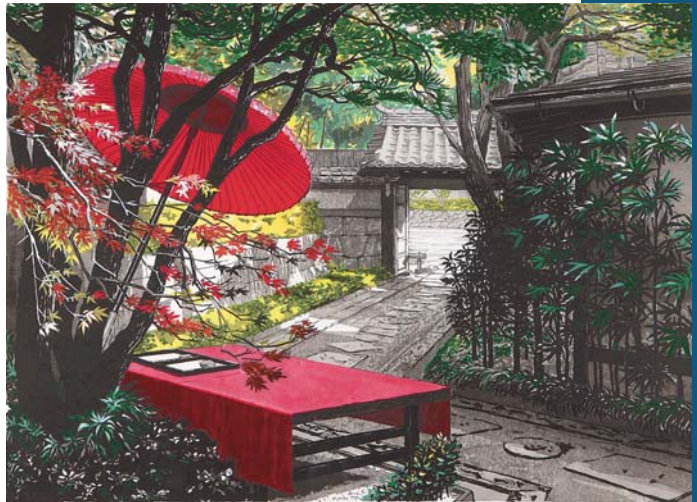
《涼庭忘夏》2008年 第40回日展入選

11歳の時、日米合作映画「大津波」で女優デビュー。1979年「魅せられて」のミリオンヒットにより、日本レコード大賞他数々の賞を受賞。